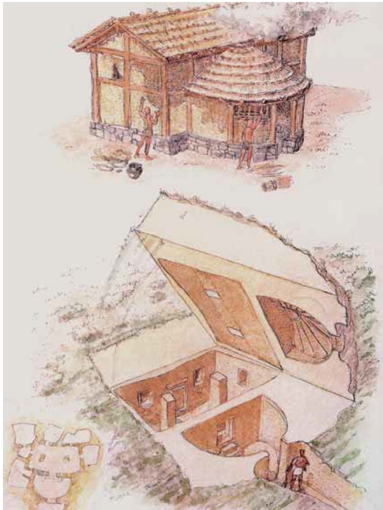
Fig. 3 - Hypothèse de reconstruction d'une cabane pré Nuragique réalisée sur la base des données de la domus de janas « Tombe des Vases Tétrapodes » de la nécropole souterraine de Santu Pedru - Alghero (Corni 2001).

Sous la ligne du plafond, il reste des traces de peinture rouge, probablement ocre, un pigment d'une valeur symbolique intense lié à la régénération du défunt et à la couleur du sang.