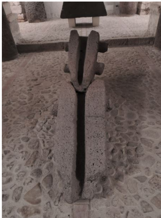
Fig. 4 - Les rigoles provenant de Funtana Oghene.

Le musée présente des témoignages de l'époque romaine comme des cippes funéraires (fig. 5), des tombes, des meules et des inscriptions (fig. 6), provenant d'une série de villages disséminés sur les collines, dans les plaines et le long des cours d'eau.