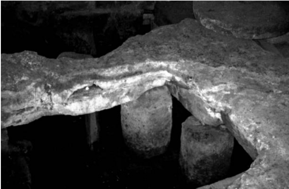
Fig. 4 - Les cippes miliaries qui soutiennent le sol de la salle 2 (Mastino, Ruggeri 2009, p. 562, fig. 8).

Les calques des cippes miliaries révèlent la titulature des empereurs du III e et du IV e siècle et ils indiquent la date de la construction de la structure thermale.