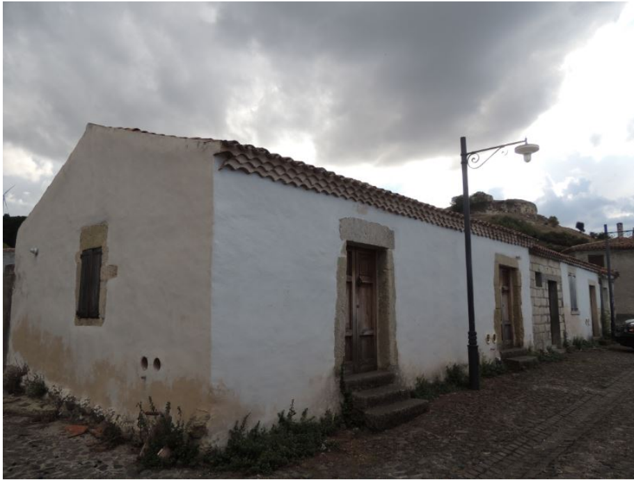
Fig. 3 - Les maisons de Rebeccu.

Les rapports avec les derniers feudataires, les Amat di Villarios, étaient si difficiles que les habitants de Rebeccu prirent part en 1795 aux insurrections contre ces derniers, détruisant les bureaux de l'administration baronniale.