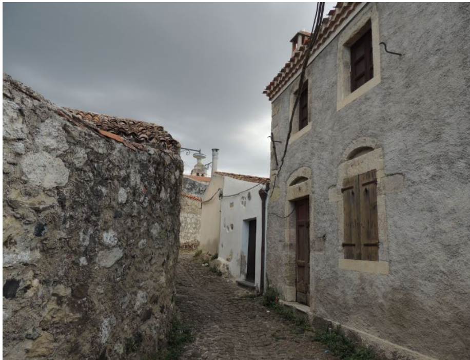
Fig. 4 - Les ruelles étroites du bourg.

Les rapports avec les derniers feudataires, les Amat di Villarios, étaient si difficiles que les habitants de Rebeccu prirent part en 1795 aux insurrections contre ces derniers, détruisant les bureaux de l'administration baronniale.