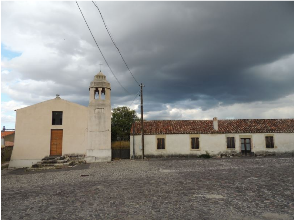
Fig. 2 - L'église du bourg (M.G. Arru).

Le noyau du village était constitué à l'origine par quatre agglomérations modestes, situées près des églises San Lorenzo et Sant'Andria, à Sa Contissa (ou Sas Presones), autour de l'église Santa Maria, à Cantaru 'Addes et par le village actuel près de l'église Santa Giulia.