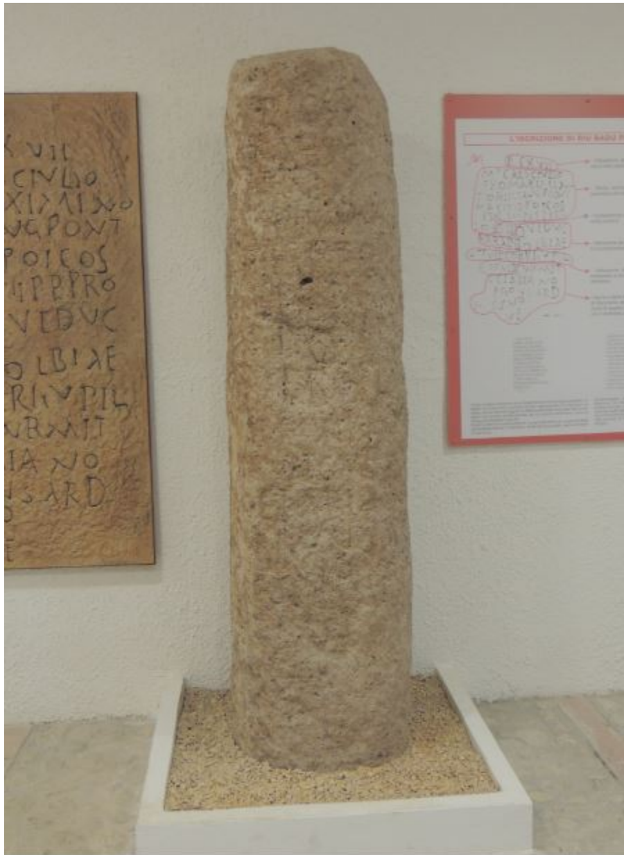
Fig. 2 - Borne miliaire provenant de la zone du Rio Badu Pedrosu, Musée Archéologique de Bonorva.

Malgré les difficultés dues à la disparition de la plupart des bornes miliaires et des voies, on peut encore identifier le parcours qui s'articulait, selon les calculs effectués, sur 65 milles, soit 96 km (fig. 3).