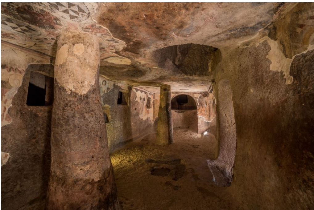
Fig. 5 - Les personnages des Apôtres à l'intérieur du bema.

Les personnages de cinq saints, dont les noms permettent de les identifier comme des apôtres, occupent les murs de droite, suivis par Saint-Jean-Baptiste, par la Vierge et par cinq autres apôtres ou saints (fig. 5-6).