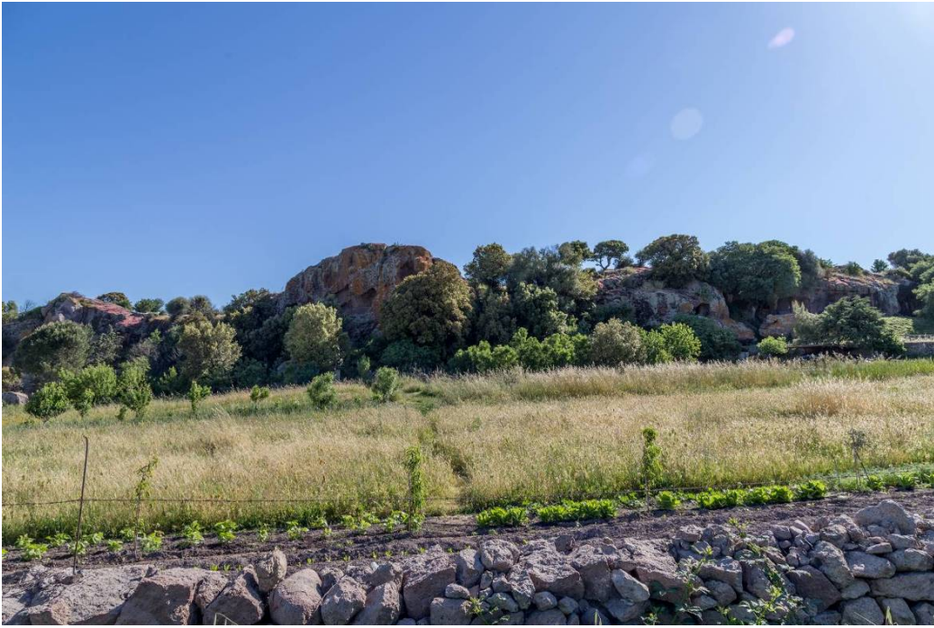
Fig. 2 - La paroi en trachyte dans laquelle on a creusé les domus de la nécropole de S. Andrea Priu.