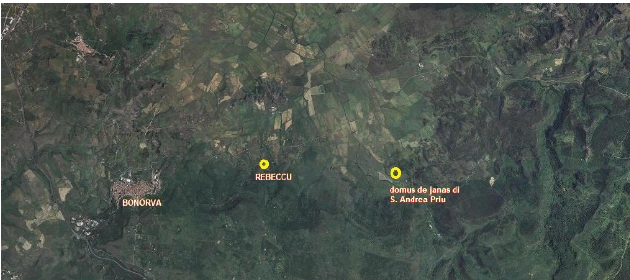
Fig. 1 - Bonorva, Rebecca et le site de la nécropole de S. Andrea Priu (Sardegnaeoportale ; réélaboration de M.G. Arru).

Il s'agit de tombes souterraines caractéristiques de la Sardaigne Prénuragique, datant de la moitié du IV e millénaire avant J.-C. et reductibles à la période de la Culture d'Ozieri (Néolithique Récent 3200-2850 av. J.-C.), qui est l'évolution et l'enrichissement d'un type de tombe déjà connu et spécifique de la culture de Bonuighinu.