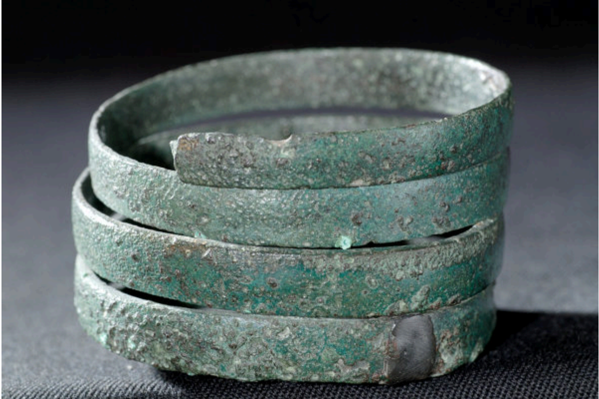
Fig. 3 – Détail de l'ornement

( http://www.beepworld.it/user/28/38/68/15/3/dsc_3274.jpg?nocache=0.024749487336630183 ).