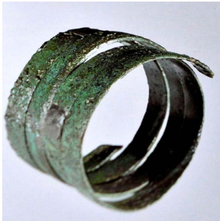
Fig. 3 - L'ornement vue de profil (ANTONA 2014, p. 63).