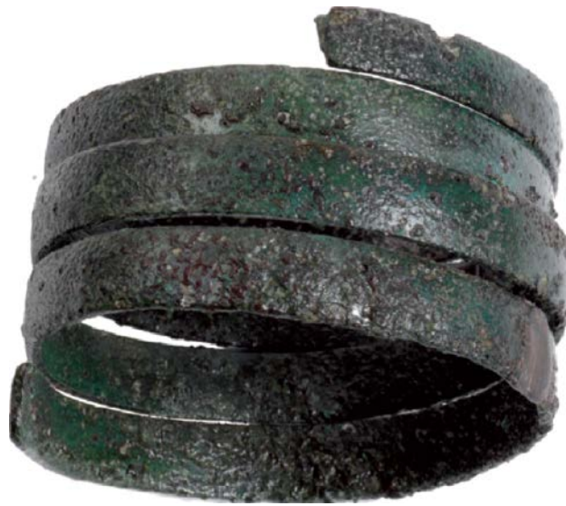
Fig. 2 - Bracelet en bronze (MERELLA 2014, p. 283).