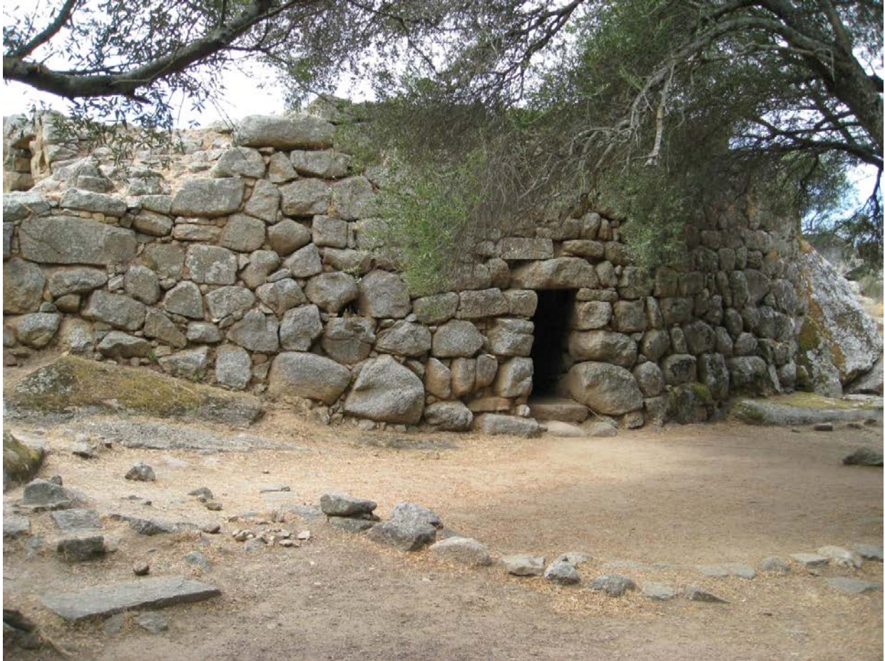
Fig. 2 - Nuraghe Albucciu.

Il s'agit d'un objet en céramique utilisé pour la cuisson des fougasses. Cette pièce, partiellement reconstruite, a la forme d'un disque ; elle est caractérisée par une légère dépression centrale et un bord arrondi (fig. 3).