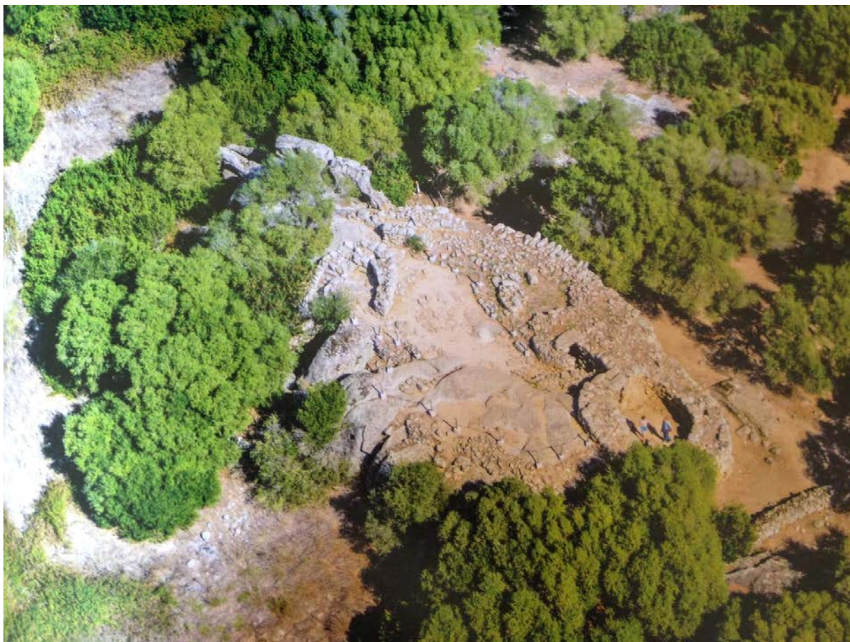
Fig. 2 - Vue du haut du nuraghe Albucciu (ANTONA 2013, p. 97).