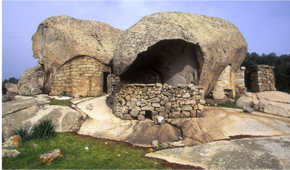
Fig. 2 - Tafoni dans le village de Pilastru à Arzachena ( http://www.anemos-arzachena.com/wp-content/uploads/2014/05/AngoliDiStoria1.jpg )

Les habitations en tafoni sont généralement réparties sur des reliefs naturellement défendus par les ravins ; dans certains cas, elles se dressent sur le territoire environnant constituant des places fortes naturelles représentant un abri, une protection et une défense. Mais elles étaient parfois ultérieurement fortifiées et adaptées par l'homme qui y ajouta des ouvrages de maçonnerie à sec.