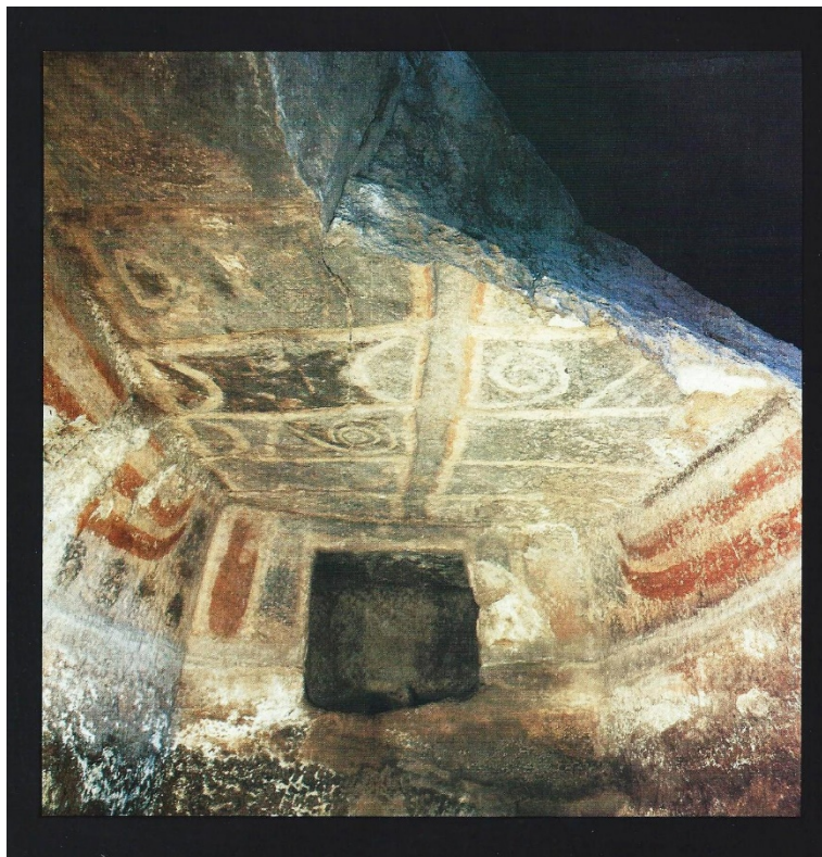
Fig. 3 - Tombe Peinte de la nécropole en domus de janas de Mandra Antine à Thiesi (Tanda 1985, fig. 30b, p. 151)

En outre, des peintures réalisées avec de l'ocre sont conservées sur les murs de nombreuses domus de janas de Sardaigne (fig. 3).