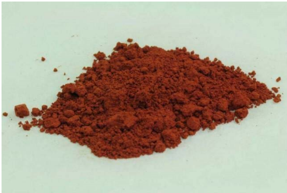
Fig. 1 - Ocre rouge.

L'ocre est un minéral terreux (une variété terreuse d'hématite) utilisé pour la préparation de substances colorantes (fig. 1).