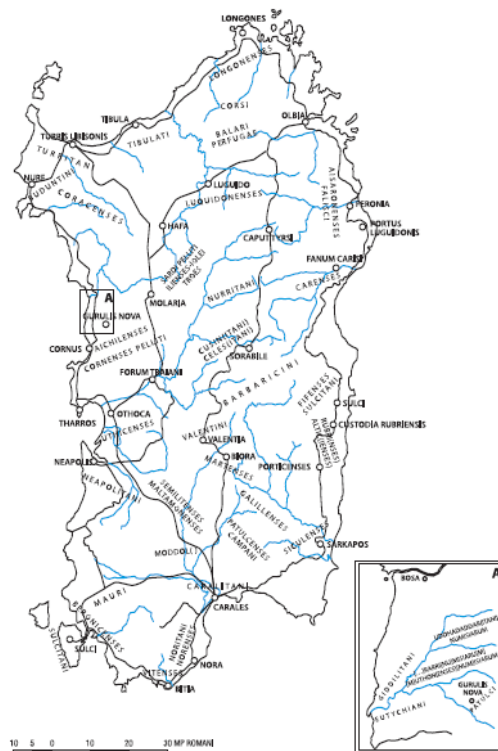
Fig. 3 - Les peuples de la Sardaigne romaine (Mastino 2005, p. 307).

Les événements qui se sont déroulés sur le territoire d'Arzachena à l'Époque Romaine sont peu connus. En outre, les quelques éléments de la culture matérielle découverts à ce jour se trouvaient pour la plupart dans les principaux complexes nuragiques. On a découvert sous l'imposante couche d'effondrement de la chambre n du nuraghe Albucciu un fragment en céramique de l'Époque Romaine. La présence de fragments en céramique de l'Époque Romaine a été signalée dans la hutte I et dans la tranchée A du complexe nuragique La Prisgiona. A Malchittu, on a recensé des tombes préhistoriques en tafoni réutilisées à l'époque romaine. En 2001, on a récupéré seize lingots de cuivre toujours reconductibles à la période de la domination romaine dans les eaux territoriales d'Arzachena, à une profondeur d'environ 20 m.