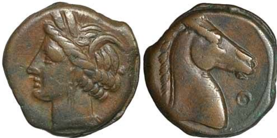
Fig. 3 - Pièce de monnaie punique provenant de Pantelleria, datant du III e siècle av. J.-C..