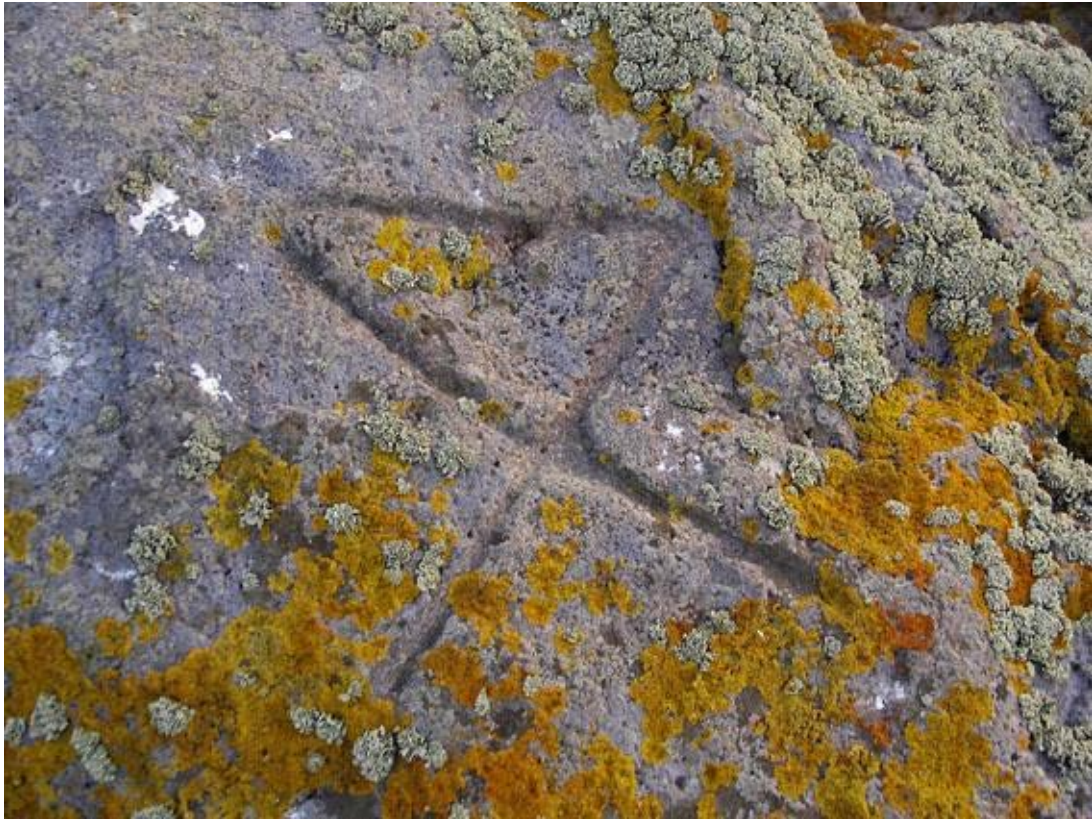
Fig. 2 - Daleth provenant du tophet de Sant'Antioco ( http://www.archeotur.it/santantioco/images/phocagallery/Aree_Archeologiche/Tofet/thumbs/phoca_thumb_l_tophet%20dalet%20e%20cisterna.jpg ).