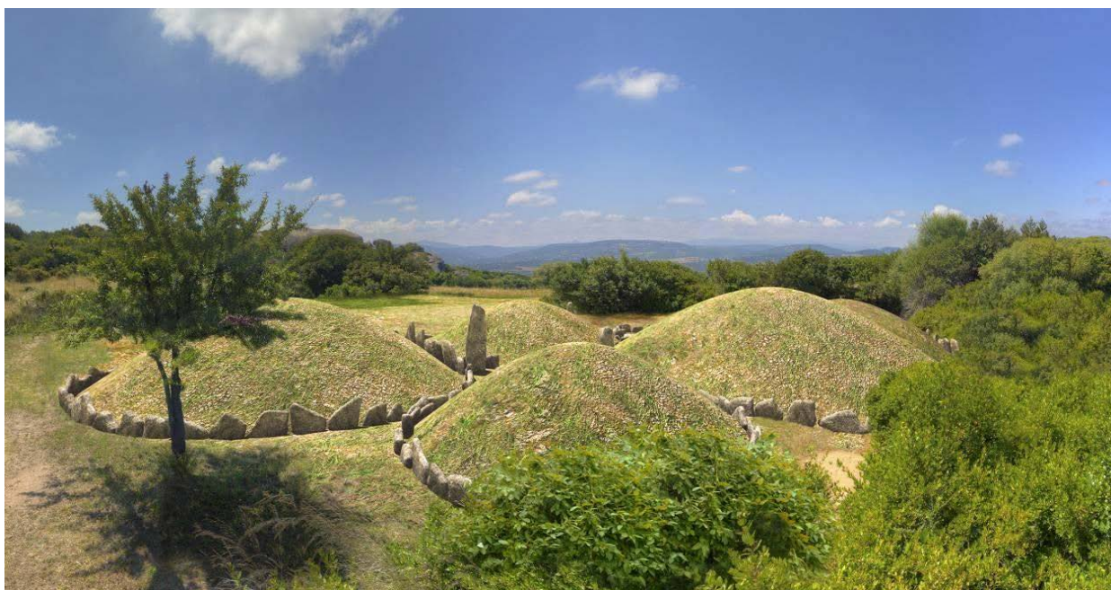
Fig. 1 - Reconstruction en 3D des cercles funéraires.

Le cercle mégalithique est un type de sépulture, utilisé dans la région historique de la Gallura, formée par une série de cercles concentriques en pierre, soutenant un tumulus de terre de couverture, au centre desquels est placée une ciste lithique qui servait de chambre sépulcrale (fig. 1).