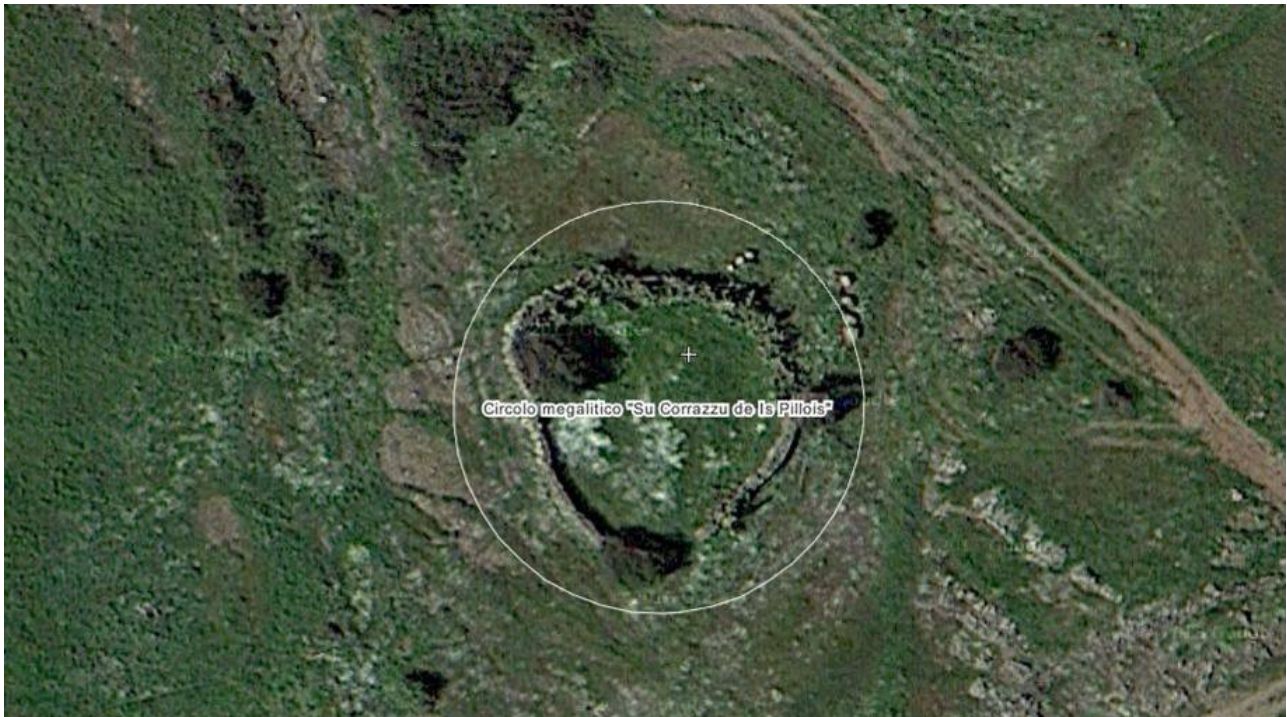
Fig. 3 – Cercle mégalithique Su Corrazzu de Is Pillois de Guspini