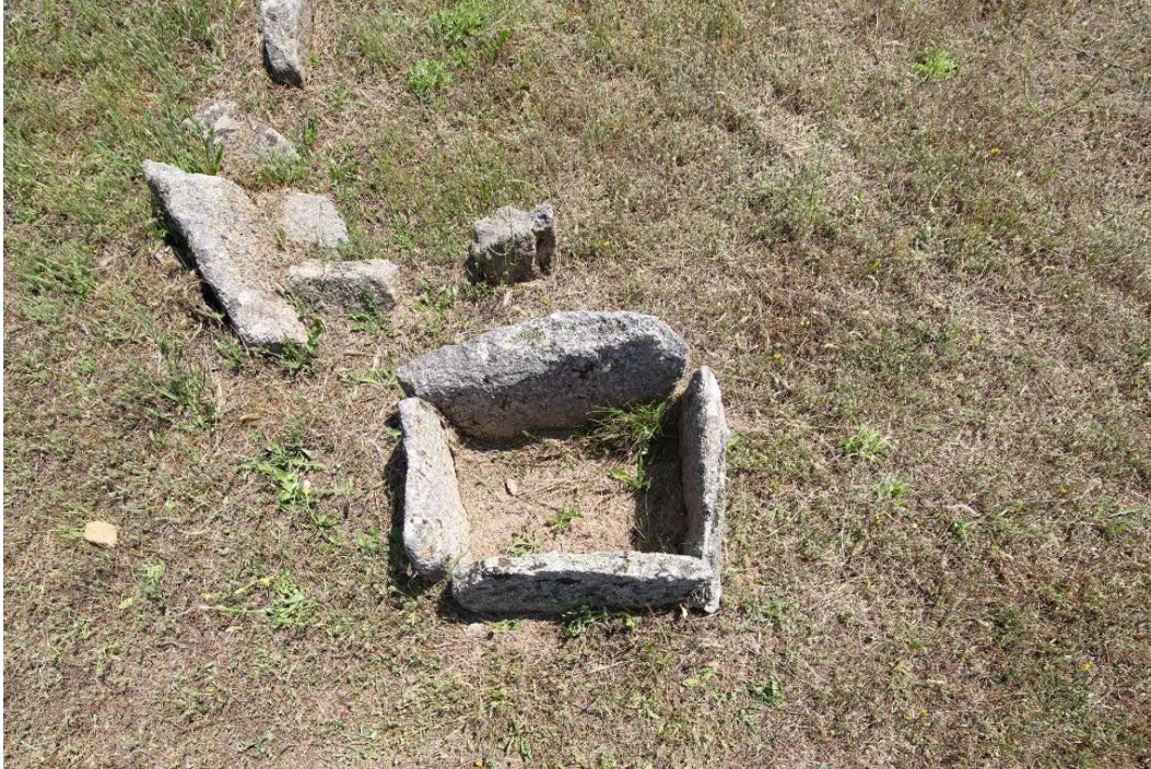
Fig. 2 - Caisson en pierre.

La présence d'autres caissons pour les offrandes placés en d'autres points de la nécropole, toujours à l'extérieur des cercles, signifie sans doute qu'on y déposait des objets utilisés au cours du rite de la sépulture (fig. 2).