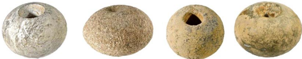
Fig. 4, 5, 6, 7 - Arzachena, Nécropole de Li Muri, sphères (Antona 2013 p. 82-83).

La tombe en cercle n° 4 contenait cinq sphères interprétées comme des symboles du pouvoir, datant probablement du III e millénaire avant notre ère ; on y retrouva également des hachettes lithiques et des éléments en pierre appartenant à un collier.