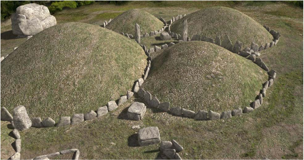
Fig. 3 - Reproduction des cercles funéraires.

La tombe en cercle n° 4 contenait cinq sphères interprétées comme des symboles du pouvoir, datant probablement du III e millénaire avant notre ère ; on y retrouva également des hachettes lithiques et des éléments en pierre appartenant à un collier.