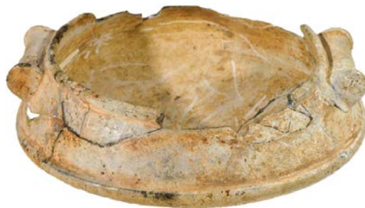
Fig. 5 - Arzachena, Nécropole de Li Muri, vase en stéatite (Antona 2013, p. 82).

La coupelle carénée en stéatite avec des anses en bobine (III e millénaire avant notre ère), conservée au Musée Archéologique National de Cagliari, provient du cercle funéraire n° 1 ; elle fait partie du mobilier du défunt, constitué par des hachettes lithiques, une sphère en stéatite verdâtre, un lissoir en pierre dure rouge, des couteaux siliceux, un pointeau en os et de nombreuses perles de collier toujours en stéatite (fig. 5).