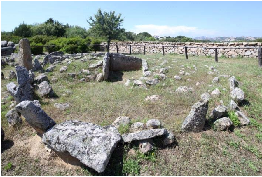
Fig. 2 - Arzachena, Nécropole de Li Muri, cercle 1.