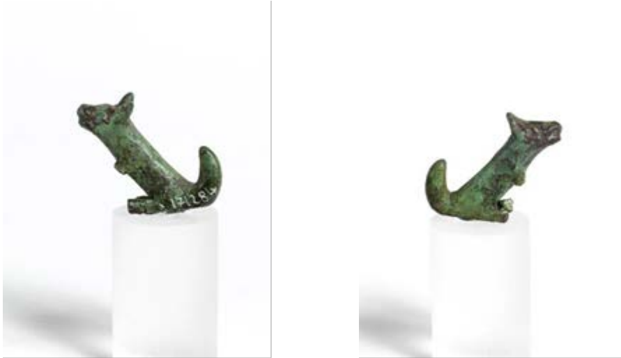
Fig. 2, 3 - Su Nuraxi, statuette en bronze représentant un chien.

gravée au niveau de la gueule. On le date de la période comprise entre le X e et le VII e siècle avant J.-C. (fig. 2, 3, 4, 5).