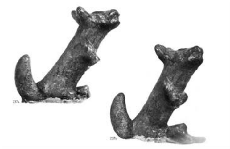
Fig. 4, 5 - Su Nuraxi, statuette en bronze représentant un chien (Lilliu 1966, p. 350).

La pièce est actuellement exposée au Musée Archéologique National de Cagliari.