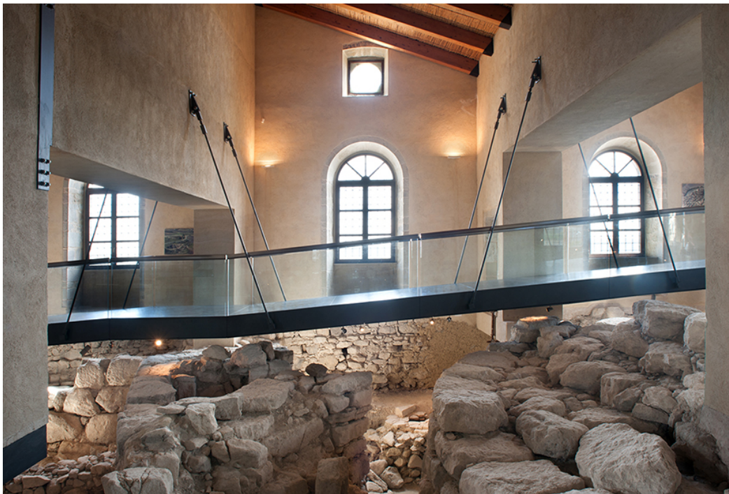
Fig. 2 - Les vestiges de Nuraxi 'e Cresia muséalisés à l'intérieur du Palais Zapata.

Les murs sont réalisés avec de gros blocs polygonaux, en marne locale et en basalte, disposés en rangées horizontales assez régulières (fig. 2, 3).