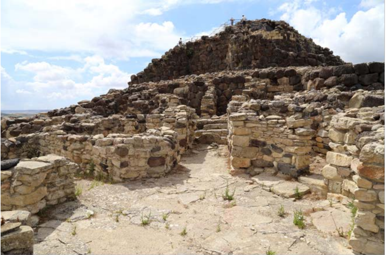
Fig. 2 - Le village à l'Âge du Fer.

selon une disposition centripète autour d'une cour centrale dallée. L'épaisseur des murs s'affine et ils sont réalisés avec des pierres de petite et moyenne dimensions, essentiellement en marne, unies avec un mortier de boue (fig. 2).