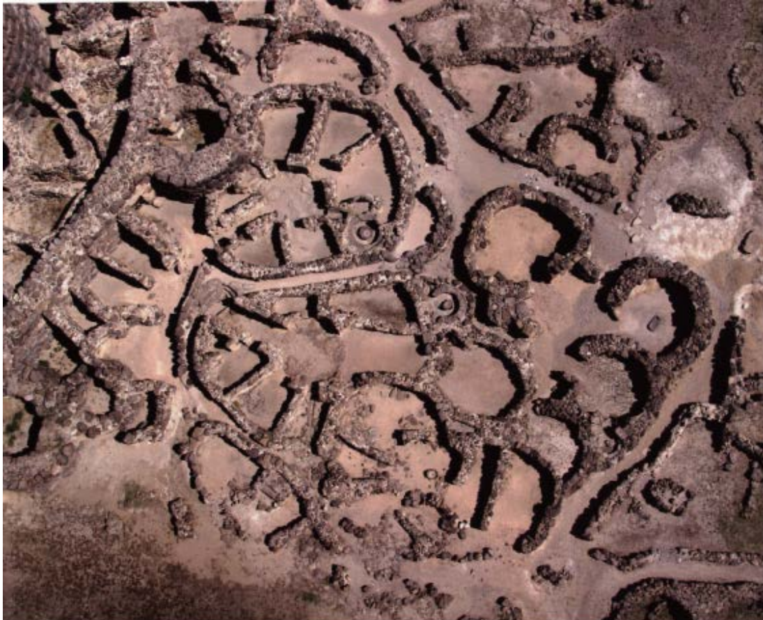
Fig. 3 - Su Nuraxi, les habitations avec une cour centrale (Ugas 2015, p. 23).