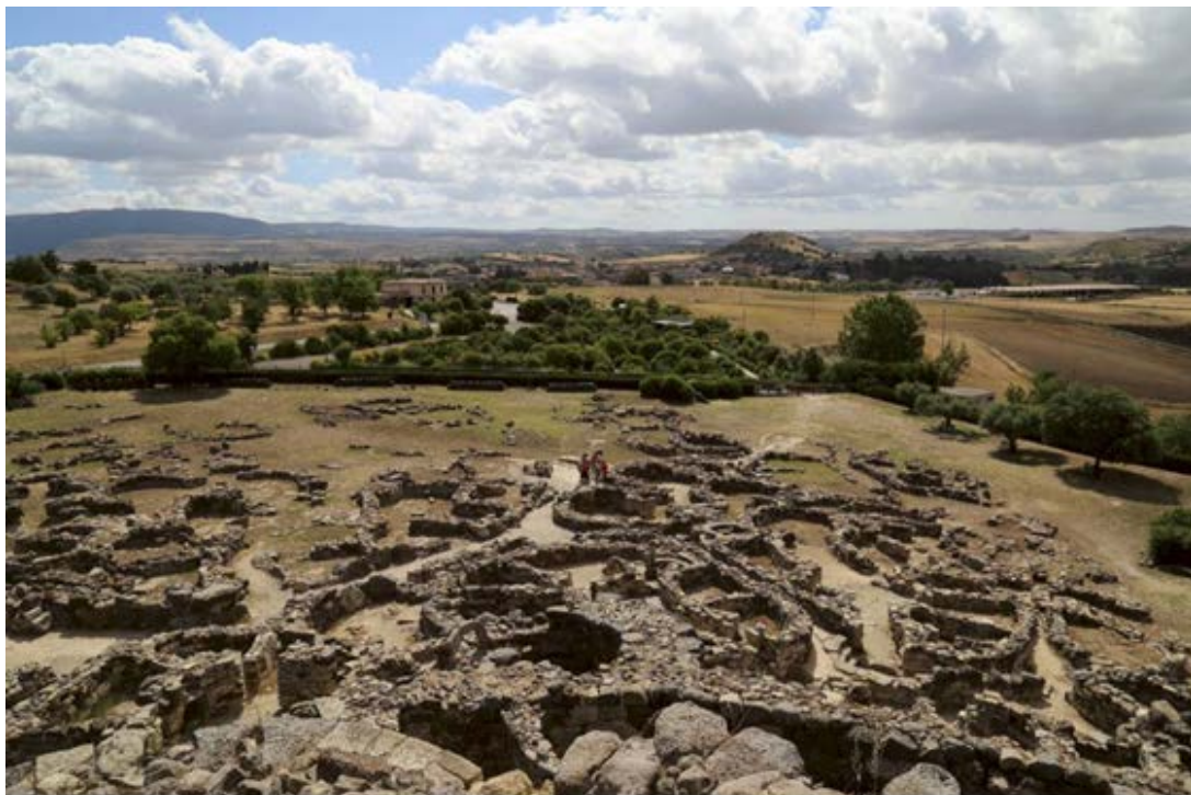
Fig. 4 - Développement planimétrique des pâtés de huttes à corps central.