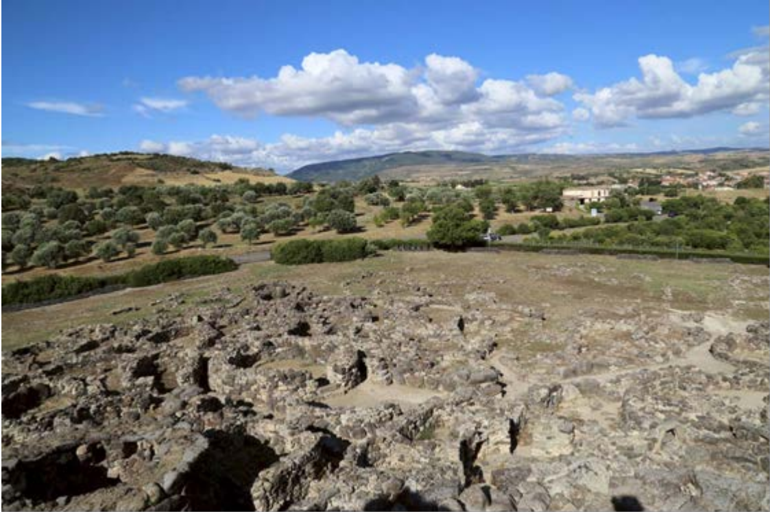
Fig. 2 - Secteur Est du village de Barumini.