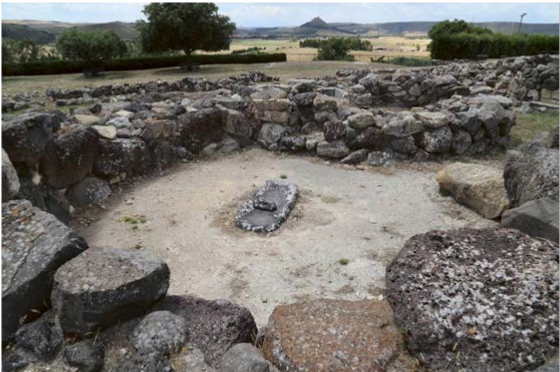
Fig. 3 - La hutte 172 du village. À l'intérieur, au centre de la pièce, meule avec roue