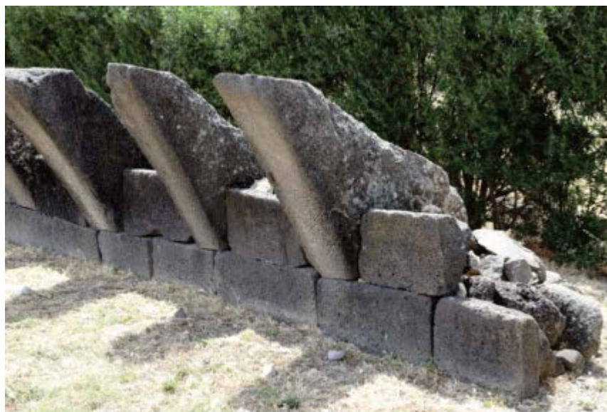
Fig. 2, 3 - Zone archéologique de Su Nuraxi, grands corbeaux et claveaux en coin disposés selon l'hypothèse de reconstruction de Lilliu.