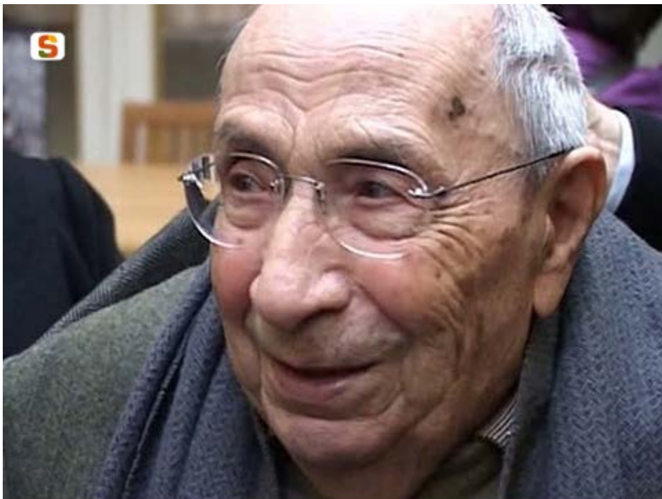
Fig. 1 - Giovanni Lilliu ( http://www.sardegнадigitalibrary.it/immagini/17_176_20090209172218.jpg ).

Giovanni Lilliu, « professori de is perdas beccias », comme il se définissait, était un archéologue de renommée internationale et un grand chercheur qui, grâce à son intense activité intellectuelle et à ses nombreuses et importantes contributions, a fait honneur à la science archéologique ainsi qu'à l'histoire, à la culture, à la vie politique et institutionnelle sarde (fig. 1).