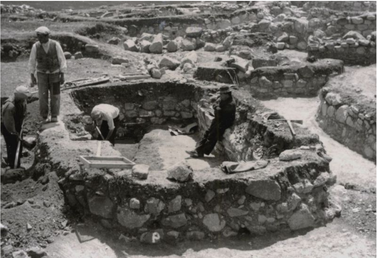
Fig. 2 - Giovanni Lilliu dirige les fouilles de la hutte 135 du village de Su Nuraxi di Barumini ( http://www.isoladelleTorri.beniculturali.it/getImage.php?id=54&w=800&h=600&f=0&.jpg ).

Lilliu doit sa renommée à la découverte du complexe nuragique de Su Nuraxi, à Barumini, son village natal (fig. 2).