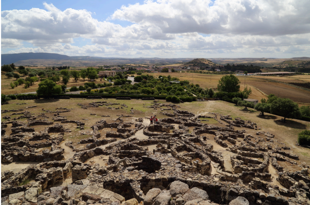
Fig. 9 - Le village.

quelques huttes « à cour centrale », attribués à la phase IIIC de la civilisation mycénienne (1210–1110 avant J.-C.). C'est au cours de la phase du Bronze Final que l'on construit la plupart des habitations du village, de forme circulaire, constituées par une seule pièce et par une toiture en bois de forme conique (fig. 9).