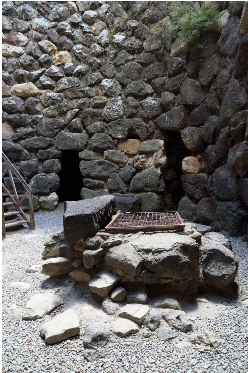
Fig. 6 - Le puits dans la cour (photo Unicity S.p.A.).

ouvert de la cour, en demi-lune, où l'on avait aménagé un puits d'eau de source, sur laquelle s'ouvraient à leur tour les entrées communicantes des tours et par lesquelles pénétrait la lumière qui éclairait les salles (fig. 6).