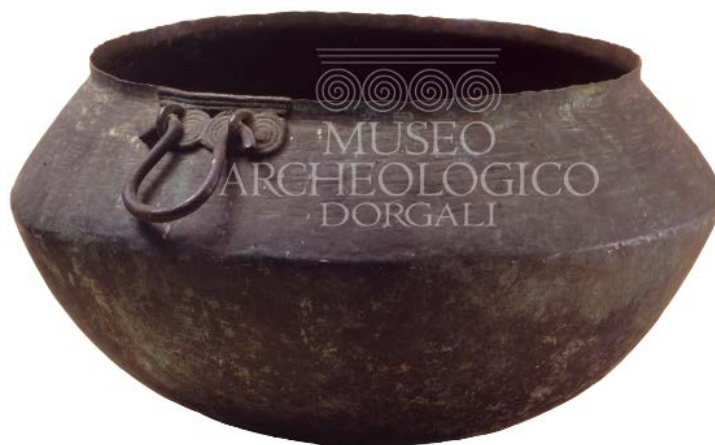
Fig. 1 - Chaudron en bronze provenant de Cala Gonone-Dorgali

Le point d'attache des anses est formé par une plaque à quatre spirales placées côte à côte, surmontées d'un motif à côtes horizontales, et munie d'une petite poignée (fig. 1, 2).