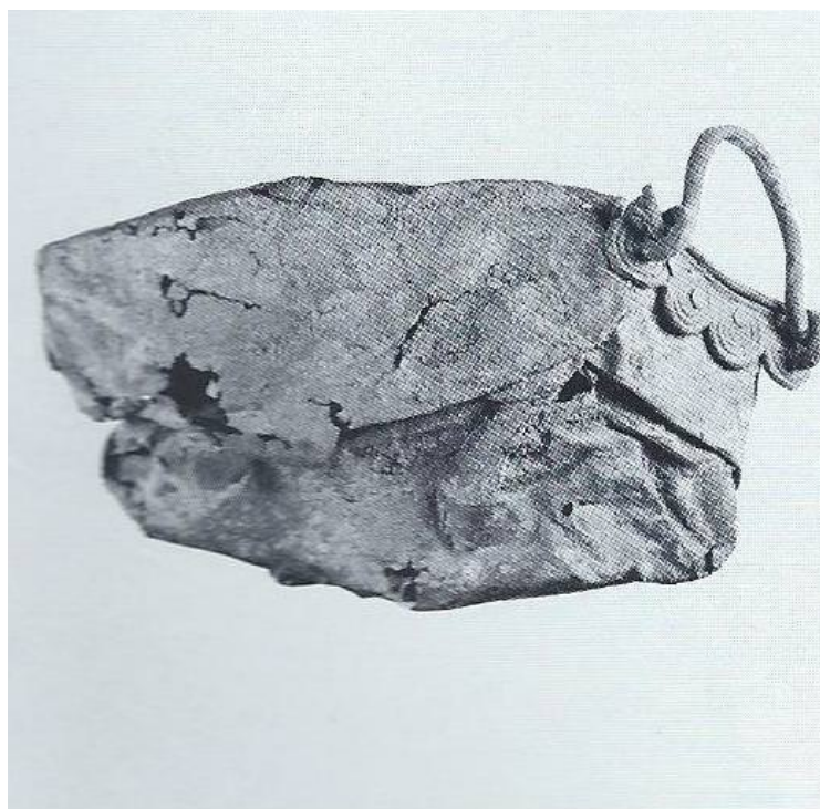
Fig. 3 - Chaudron écrasé provenant du débarras de San Francesco de Bologne (LO SCHIAVO 1990, p. 250, fig. 235).

Cet exemplaire présente des points communs avec un autre chaudron analogue fabriqué en Sardaigne, découvert complètement écrasé comme un déchet métallique dans le débarras de San Francesco de Bologne ; il est exposé aujourd'hui au Musée archéologique communal de Bologne, quiidylle présente la même fixation de l'anse à quatre spirales (fig. 3).