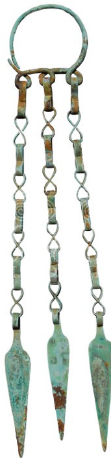
Fig. 1 - Pendentif provenant de Tillai-Dorgali ( http://www.museoarcheologicodorgali.it/wp/wp-content/uploads/2014/09/7.png ).

Le site de Tillai 1 , sur le territoire de Dorgali, a restitué un pendentif 2 en bronze à chaînettes avec des pendentifs en forme de feuilles et lancéolés (fig. 1) actuellement exposé au Musée Archéologique de Dorgali, avec d'autres pièces analogues provenant de la même localité.