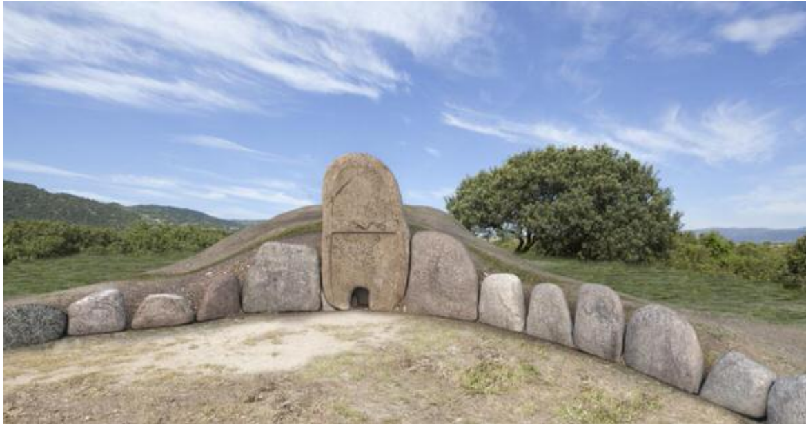
Fig. 2 - Reproduction de l'espace de l'exèdre de la tombe des géants de Thomes, Dorgali.

Elle mesure 14 cm de haut et appartient à la catégorie des céramiques revêtues du type « partiellement vitrifié », indiquant que la vitrification ne recouvre que quelques parties de la surface de l'objet 1 . Elle est attestée en Italie au cours de l'Antiquité Tardive et du Haut Moyen-Âge. Dans les contextes archéologiques péninsulaires, ce type de céramique est attesté par exemple dans les villages toscans de Scarlino-Grossetto et de Rocca San Silvestro-Livourne, ainsi qu'en Arezzo, à Lucques et à Chiusi, et plus en générale elle est bien documentée dans les régions italiennes du centre. La bouteille découverte à Thomes présente un fond plat, apode, un corps au profil sub-cylindrique relié à une épaule tronconique, un col cylindrique, une lèvre légèrement convexe. La pâte est dure, épurée de couleur rouge-brune (fig. 3, 4). Les zones concernées par le revêtement, plus épaisses, sont marquées par une vitrification plus brillante, de couleur vert olive, mais toutefois bulleux et irrégulier. Les zones restantes, qui ont été davantage absorbées par la pâte, sont mates, avec des tâches aux nuances jaunes–orange.