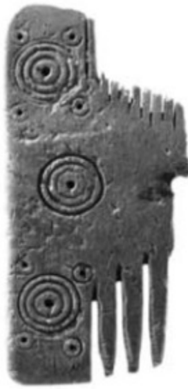
Fig. 4 - Peigne en os provenant de Santa Filitica (ROVINA, GARAU, MAMELI, WILKENS, fig. 13.7, p. 264).

La pièce est exposée au Musée Archéologique Communal de Dorgali.