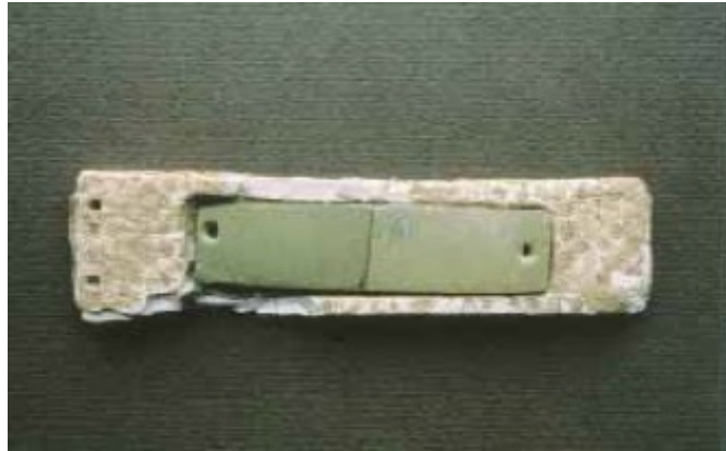
Fig. 2 - Brassard (plaque pour protéger le poignet de l'archer) avec une gaine en os décorée avec des « yeux de dé », provenant de la Domus XIII de la nécropole souterraine d'Anghelu Ruju-Alghero (LILLIU 1999, fig. 173, p. 141).