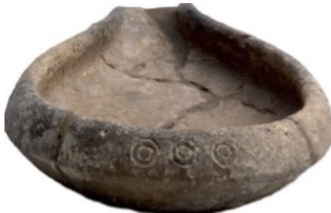
Fig. 3 - Lampe à huile en forme de cœur provenant du complexe nuragique Su Nuraxi-Barumini datant de la période comprise entre le IXe et le VIIIe siècle av. J.-C. avec une décoration en cercles en « yeux de dé » (BAGELLA 2014, p. 261).