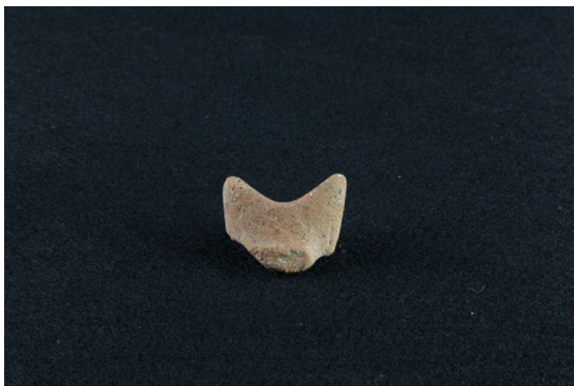
Fig. 1, 2 - Fragment d'anse surélevée avec pointes cornues provenant de Thomes.