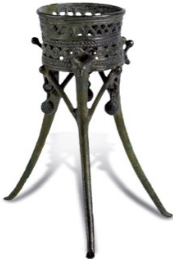
Fig. 5 - Tripode en miniature provenant de la grotte Pirusu-Su Benatzu de Santadi ( http://www.museoarcheologicosantadi.it/aree-archeologiche/il-tempio-di-su-benatzu/arredi-e-corredo-sacro/par_1/img_0/image_preview ).

On utilisait à l'époque de la civilisation nuragique, au cours de la phase du Bronze Final (XII e -IX e s. av. J.-C.), de petits supports tripodes votifs en bronze, de la tradition chypriote (fig. 5).