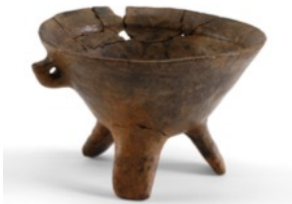
Fig. 4 - Tripode du Bronze Ancien avec anse coudée et un un prolongement en forme de hache provenant de la Grotte loc. Is Carillus de Teulada/Santadi (MANUNZA 2014, fig. 1, p. 58).