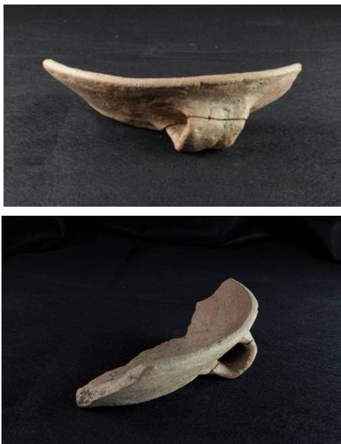
Fig. 1, 2 - Fragment de casserole provenant de la tombe des géants de Thomes-Dorgali.

Un des fragments en terre cuite découverts dans la tombe des géants de Thomes-Dorgali appartient à un type de casserole aux parois convexes et au fond non identifié. Sa lèvre est arrondie, ses parois sont considérablement inclinées vers l'extérieur, son fond est plat et son anse 10 en ruban est fixée de la paroi au fond. La surface de couleur brune a été lissée ; la pâte, brute et grossière, est elle aussi de couleur brune (fig. 1, 2, 3).