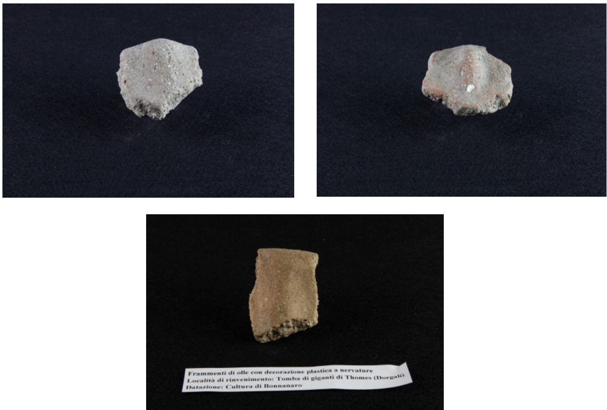
Fig. 1, 2, 3 - Fragment de parois d'urnes provenant de Thomes-Dorgali ornées d'un motif à nervures verticales en relief sous la lèvre.

Au cours des fouilles de 1977 dans la tombe des géants de Thomes, on a retrouvé des fragments de lèvres et de parois décorées d'applications plastiques constituées par des motifs à nervures disposés verticalement (fig. 1-3), associés à une forme en céramique caractéristique des vases pré-nuragiques et nuragiques, l'urne, très répandue dans les contextes funéraires des tombes des géants, dont on a également retrouvé des exemplaires dans les villages et dans les nuraghi.