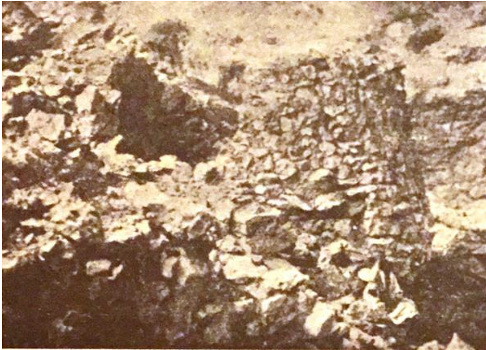
Fig. 2 - Village nuragique de Tiscali (TARAMELLI 1933, fig. 4, p. 443).