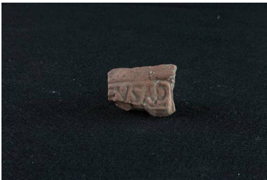
Fig. 2 - Fragment de claveau avec sceau gravé dans une cartouche rectangulaire [EVSAP] découvert dans la tombe des géants de Thomes-Dorgali.

Les découvertes les plus anciennes comprennent également le fragment de la paroi d'un pichet achrome (fig. 3), découvert à proximité de l'exèdre, qui conserve les traces d'une inscription graphite reconductibles à des contextes datant de la période comprise entre le IV e et le III e siècle av. J.-C. (Période Républicaine).