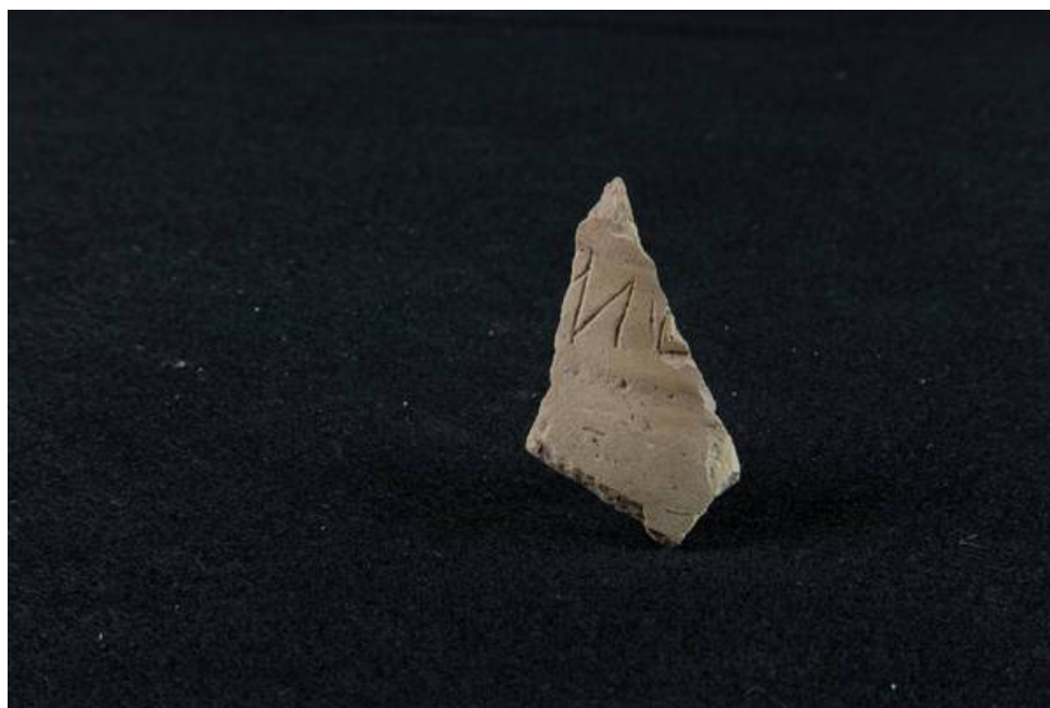
Fig. 3 - Fragment de la paroi d'un pichet achrome avec une inscription latine gravée provenant de Thomes-Dorgali

Les découvertes les plus anciennes comprennent également le fragment de la paroi d'un pichet achrome (fig. 3), découvert à proximité de l'exèdre, qui conserve les traces d'une inscription graphite reconductibles à des contextes datant de la période comprise entre le IV e et le III e siècle av. J.-C. (Période Républicaine).