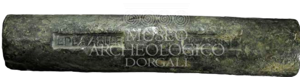
Fig. 3 - Lingot en plomb récupéré ans les eaux de Cala Cartoe-Dorgali et datant des IIe-Ier siècles av. J.-C. ( http://www.museoarcheologicodorgali.it/wp/museo_archeologia_in_sardegna/la-storia-di-dorgali-in-20-reperti/ ).

Une des localités à laquelle on doit se référer pour définir l'histoire du paysage et la géographie du territoire, est celle de la station romaine Viniolae dans les campagnes de Dorgali (site de Finiodda, vallée de l'Oddoene), mentionnée par l' Itinerario Antoniniano , située le long du parcours en direction de Portu Tibulas Karalis . C'est justement à proximité de cette voie, qui se développait le long de la côte orientale de la Sardaigne, que se situaient les villages les plus connus. D'autres sites ont été reconnus sur les deux diverticula , c'est-à-dire les branches transversales en direction de l'intérieur, vers la vallée d'Isalle et d'Oliena, et la Barbagia interne.