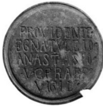
Fig. 2 - Disque en bronze avec inscription de l'époque romaine tardive provenant de Siddai-Dorgali (DELUSSU, IBBA 2012, fig. 2, p. 2197).