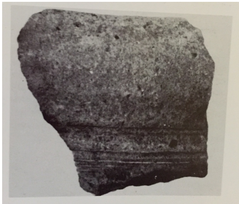
Fig. 2 - Grotte de Sos Sirios-Dorgali, fragment d'amphore massaliote (MANUNZA 1995, fig. 262, p. 197).

quelques perles de collier en pâte de verre récupérées dans les tombes nuragiques de Bistriddi I et Pranos, dans les abris sous roche d'Ispinigoli e Littu, Sos Tusorzos, Balu Virde et Flumineddu. Deux objets en céramique d'importation, un fragment d'amphore massaliote récupérée dans la grotte de Sos Sirios et un fragment de tuile grecque orientale avec un fond peint découverte dans le village nuragique d'Oroviddo (580-480 av. J.-C.), attestent les relations avec le monde grec-oriental, dans le cadre desquels les Carthaginois pourraient avoir joué le rôle d'intermédiaires commerciaux (fig. 2, 3).