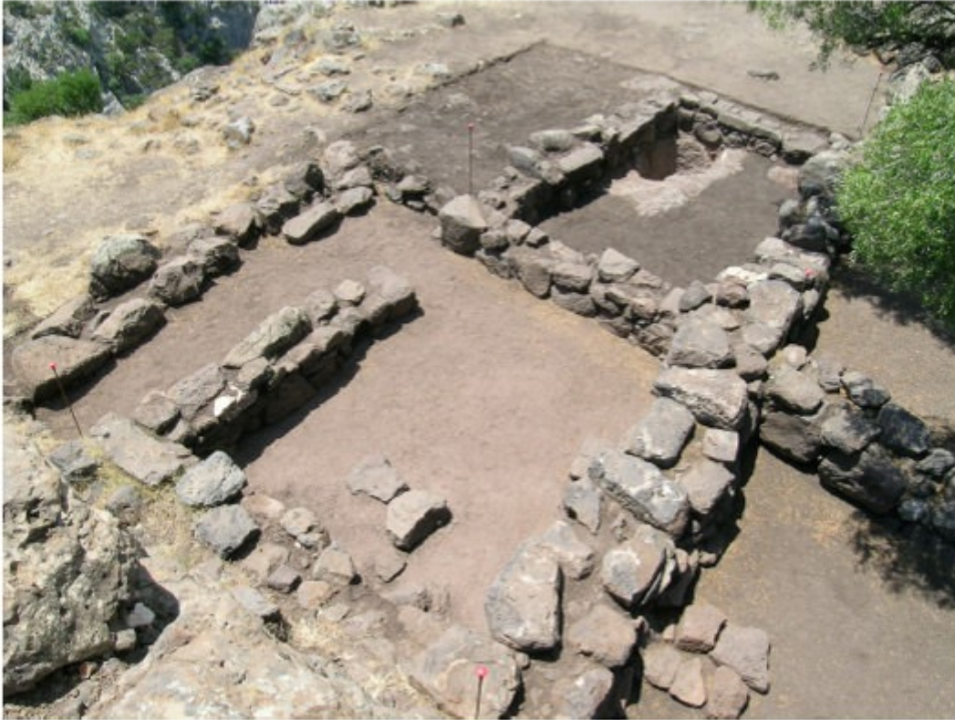
Fig. 4 - Bâtiments romains, zone 3000 de Nuraghe Mannu (LUSSU 2009, fig. 4, p. 3).

La vie quotidienne à l'Époque Romaine est documentée par de nombreux fragments en céramique, des pièces métalliques, des pièces de monnaie et des restes d'animaux. Sur le site est également attestée une phase historique successive ainsi qu'une phase Byzantine et du Haut Moyen-Âge des IV e -VI e siècles de notre ère.