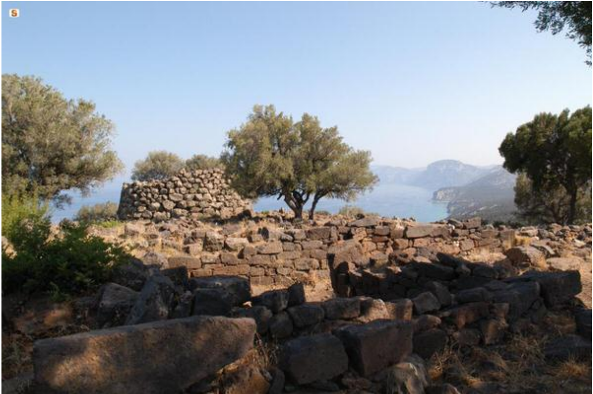
Fig. 3 - Nuraghe Mannu-Dorgali ( http://www.sardegnaigitallibrary.it/mmt/1920/412295.jpg ).

Le village de l'Époque Romaine (fig. 4), datant de la Période Républicaine et de la Période Impériale tardive (II e siècle av. J.-C. - VI e siècle ap. J.-C.), comprend des logements de deux pièces dont les murs ont été construits suivant la technique isodome, souvent réutilisés, et avec des pierres semi-finies, posées à sec, avec des toitures à une ou deux pentes en tuiles, soutenues par des poutres en bois.