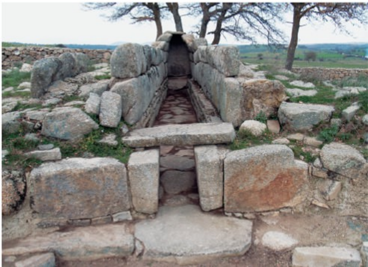
Fig. 3, 4 - Tombes des géants II-III de Madau-Fonni (MORAVETTI 2014, p. 58-59).