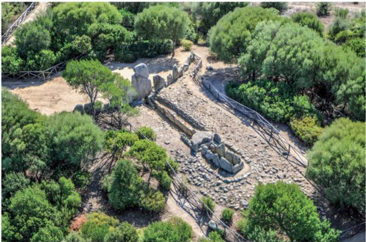
Fig. 2 - Tombe des géants Li Lolghi-Arzachena (MORAVETTI 2014, p.53).

Ce type de monument, dérivant du dolmen, représente en synthèse l'évolution des tombes à galerie couverte, c'est-à-dire les allées couvertes. Elles sont constituées par un long corps avec une partie finale en demi-cercle (abside), et une partie frontale courbe qui se prolonge latéralement en deux ailes d'un mur qui entourait une zone rituelle appelée l'exèdre. Le monument atteint sa hauteur maximale au centre de l'exèdre puis celle-ci diminue progressivement vers les extrémités des ailes et vers l'abside. Au centre et au nord de la Sardaigne, au cours du Bronze Moyen II (1400-1300 av. J.-C.), la tombe à orthostates et stèle cintrée (fig. 2) fut remplacée par un type de tombe construit en maçonnerie suivant la technique isodome ou à blocs polygonaux, sans stèle, avec une entrée surmonté d'une architrave (fig. 3, 4).