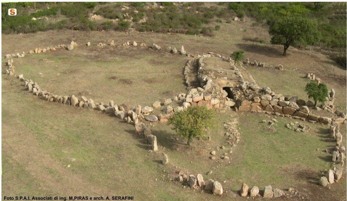
Fig. 4 - Tombe des géants de San Cosimo-Gonnosfanadiga ( http://www.sardegnaigitallibrary.it/index.php?xsl=615&s=17&v=9&c=4461&id=103511 ).