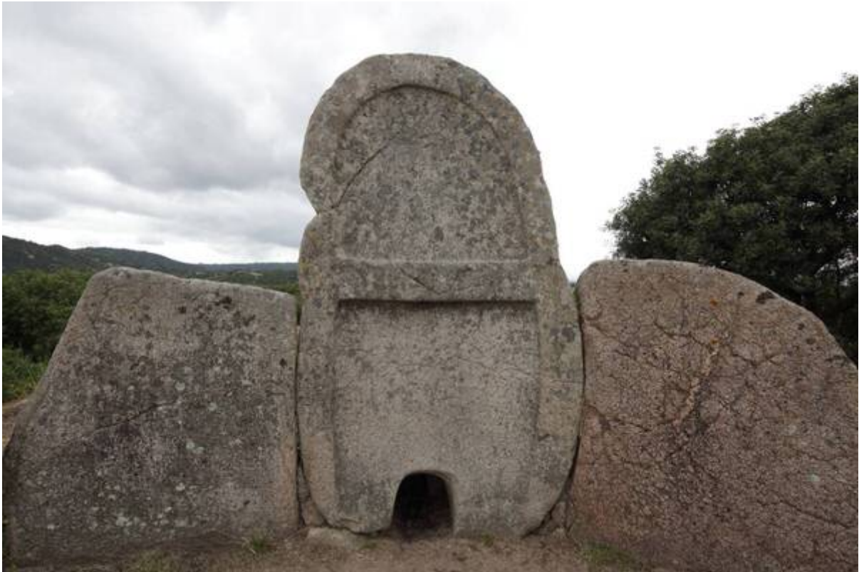
Fig. 3 - Entrée de la tombe de Thomes.