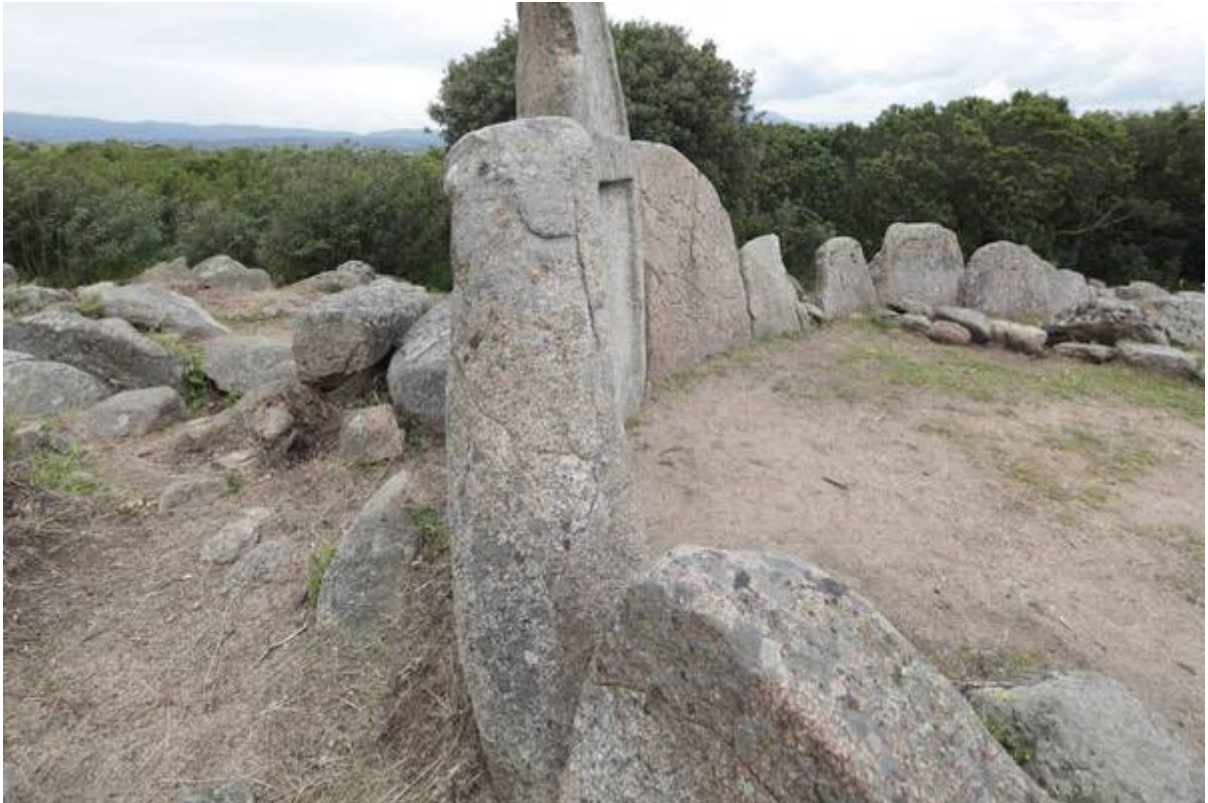
Fig. 2 - Profils de l'exèdre de la tombe des géants de Thomes.

L'orthostate central coïncide avec l'entrée et avec la stèle cintrée (fig. 3).