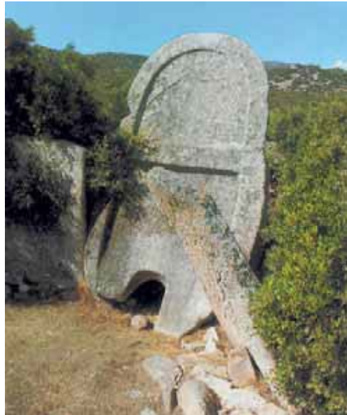
Fig. 2 - La tombe des géants de Thomes avant les travaux de fouilles et de restauration (MORAVETTI 1998, fig. 22, p. 30).

Durant l'été 1977, la tombe (fig. 2) a été fouillée et restaurée sous la direction scientifique de Francesco Nicosia, le Surintendant de l'époque pour les biens archéologiques des provinces de Sassari et Nuoro.