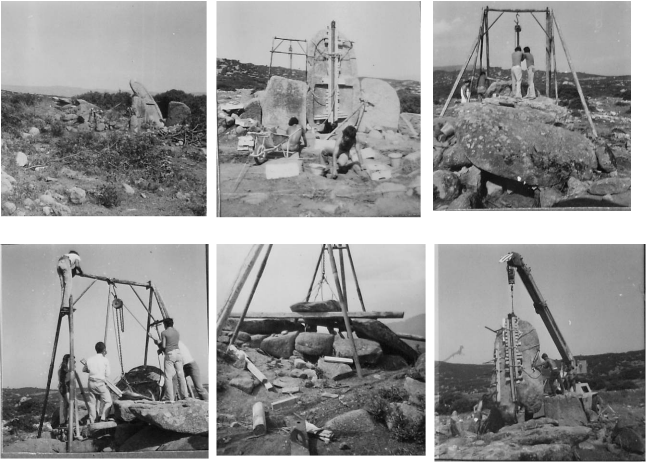
Fig. 3, 8 - Série d'images du répertoire inhérentes à l'intervention archéologique de 1977 dans la tombe des géants de Thomes-Dorgali.

Les altérations de la tombe antérieures à interventions étaient plutôt évidentes : les orthostates de la façade étaient détachés et la stèle était fortement inclinée. Le couloir funéraire, en partie découvert et dépourvu de quelques-unes des plaques de la toiture qui avaient été déplacées, avait fait plusieurs fois l'objet de fouilles clandestines. Les travaux de restauration ont permis de récupérer pratiquement toute la structure (redressement de la stèle, réalignement des orthostates de l'exèdre, reconstruction partielle du mur interne du couloir funéraire et réaménagement de la toiture de ce dernier), construite dans un granit local, et de découvrir des astuces techniques utilisées pour son édification. Les fouilles de l'exèdre, de la chambre funéraire et du rebord en pierre sur lequel se dressait le tumulus ont restitué une séquence stratigraphique plutôt simple, marquée par une altération substantielle de la situation d'origine en particulier dans l'exèdre et dans la chambre.