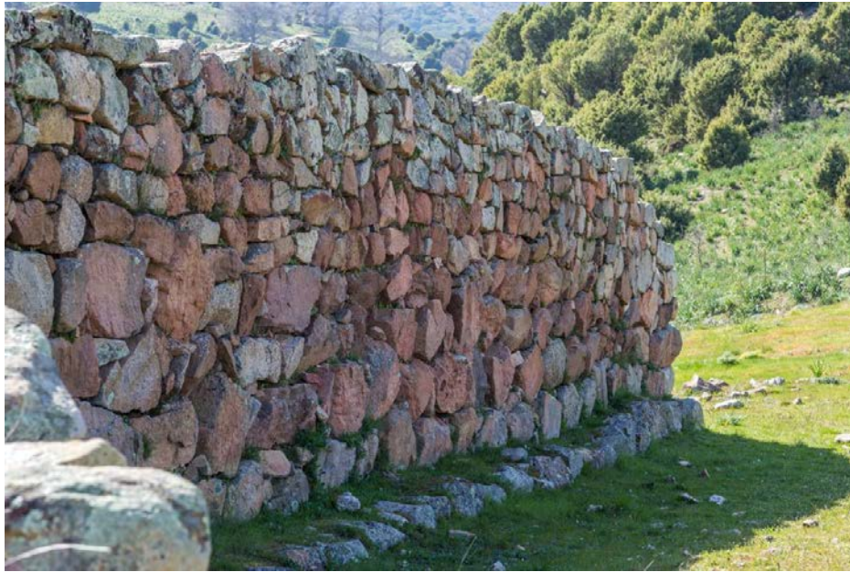
Fig. 2 - Détail du secteur extérieur du temple en mégaron 1.

Ce dernier a justement été mis en relation avec la destruction des châssis en bois représentés par des pieux en bois et les branchages, équivalant à la couverture d'origine du toit à double pente, complétée par une inclinaison réalisée moyennant la pose des plaques lithiques (fig. 3).