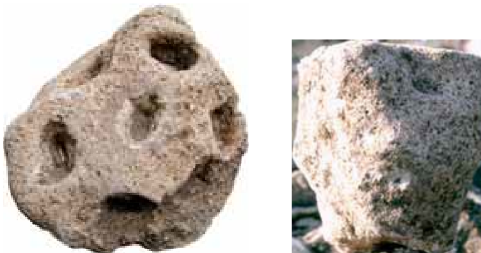
Fig. 1, 2 - Le nuraghe en miniature découvert près du temple en mégaron A (FADDA 2012, fig. 15-16, p.13-15).

Le fragment résiduel de la sculpture (dimensions : hauteur de 18 cm ; diamètre de 15 cm) a été réalisé suivant la technique de la gravure et du ponçage de la pierre calcaire. Il reproduit en miniature la tour simple d'un nuraghe, dont le fût cylindrique est marqué par un redent qui le distingue de la représentation de la terrasse du sommet. Dans la partie supérieure, sept trous elliptiques, disposés en cercle, dont un au centre, servaient à introduire les offrandes votives en bronze liées aux rituels religieux qui se déroulaient dans le secteur du temple (fig. 1, 2, 3).