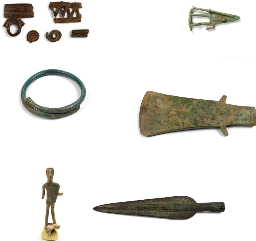
Fig. 2, 3, 4, 5, 6, 7, 8 - Objets en bronze.

des chaudrons, des pointes et des extrémités de lance, des boutons, des poignards, des navettes entassés, intacts ou fragmentaires, sont identifiables comme des offrandes votives stockées en vrac dans trois dépôts des insulae pour être refondues, démontre l'existence d'un vaste commerce interne de produits de la métallurgie sur le territoire de l'Ogliastra.