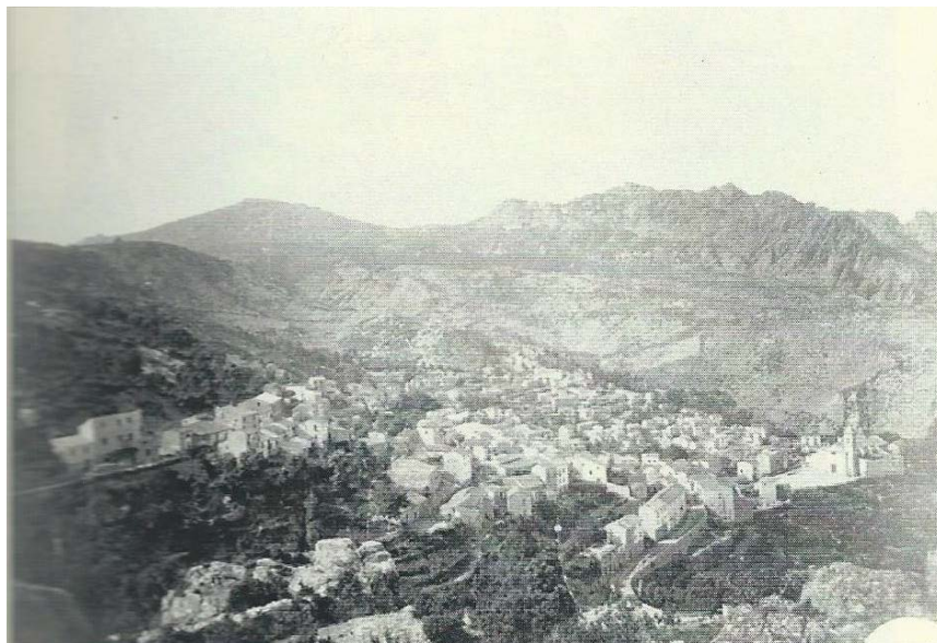
Fig. 3 - Vue panoramique du village datant des années 50 (E. Cannas et D. Casari 2014, photo 1).

Dans son article relatif à Villagrande Estrisali , Angius indique qu'au début du XIX e siècle, cette commune comptait 225 maisons, 263 familles et 1114 habitants , essentiellement concentrés dans le quartier mentionné ci-dessus, comme il émerge des premières cartographies du village, c'est-à-dire celles de l'Archivio del Real Corpo di Stato Maggiore (Archivio La Marmora) de 1840-1845 (fig. 3).