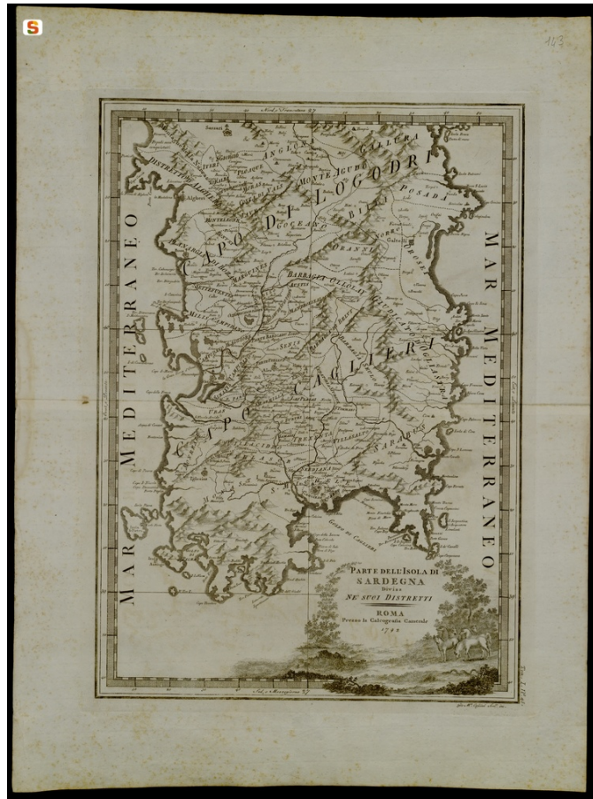
Fig. 1 - Le Judicat d'Ogliastra cartographié dans l'ouvrage de 1792 Parte dell'Isola di Sardegna Divisa in e suoi Distretti de Cassini Giovanni Maria ( http://www.sardegnaigitallibrary.it/index.php?xsl=626&s=17&v=9&c=4461&id=13571 ).