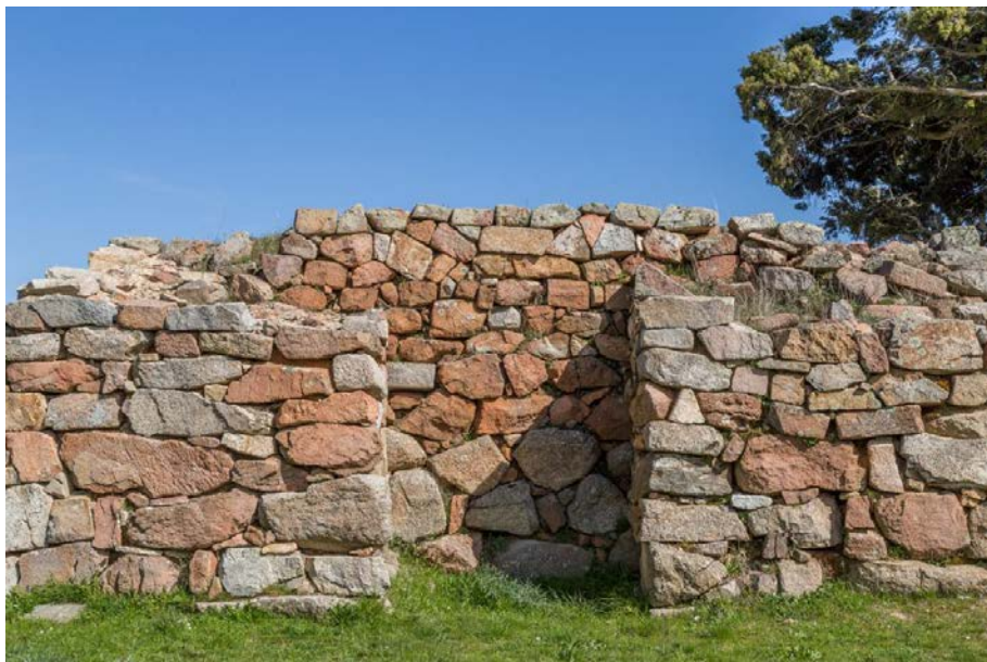
Fig. 3 - Détail de l'arrière de la façade du temple en mégaron 1.

La structure planimétrique du monument semble être reconductible à deux phases distinctes de construction qui ont mené, après un incendie (XII e -XI e siècle av. J.-C.) à une nouvelle répartition de l'espace interne et surtout à la restructuration des côtés et de l'arrière de la façade d'un bâtiment plus ancien du type en antis double, c'est-à-dire muni d'antes sur la façade et à l'arrière (fig. 3).