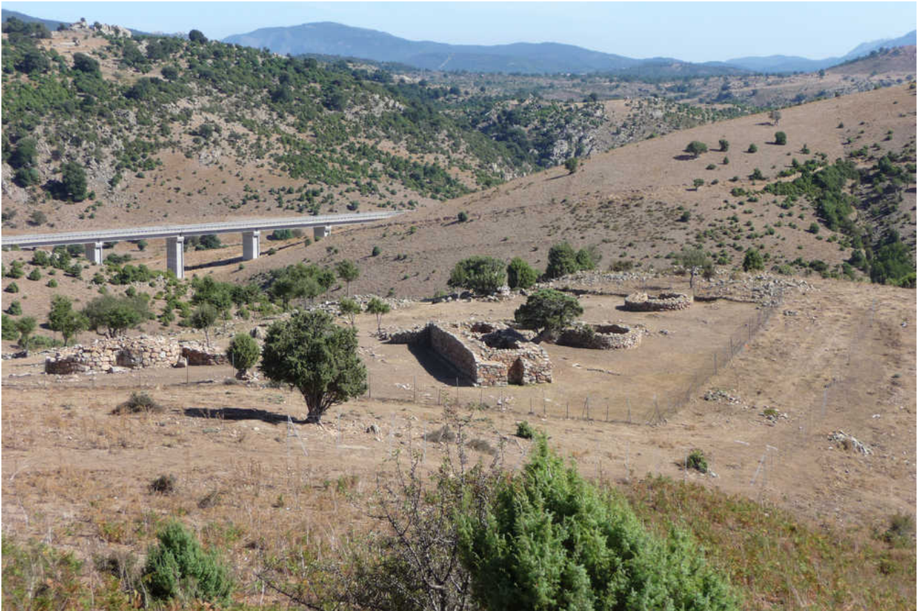
Fig. 3 - Vue panoramique du site ( http://www.beniculturali.it/mibac/export/MiBAC/sito-MiBAC/MenuUtility/Immagine/index.html_647931255.html ).

Dans les années 80 et 90, les interventions de fouilles du premier temple en mégaron, dont certaines avaient toujours pour objectif de mettre fin aux pillages clandestins, ont mis l'accent sur l'importance du site et elles ont indiqué le type, l'extension et la consistance du temple, ainsi que les différentes phases d'utilisation et les rapports présumés avec le village contigu, en prouvant, sur la base du contexte matériel, qu'il avait été construit sur une agglomération bien plus ancienne. Dans les années 2007-2011, d'autres campagnes de fouilles ont permis de mettre au jour deux autres temples inédits, dont le mégaron 2, un autel particulier dans la salle du fond en abside, construit avec des blocs équarris de roche volcanique dont la façade est décorée de deux protomés de bélier en haut-relief, surmontée d'un foyer rituel réalisé avec différents blocs en basalte imitant le couronnement d'une tour nuragique.