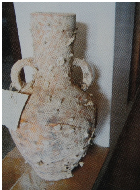
Fig. 1 - Petites amphores provenant de la mer d'Arbatax (SALVI ET ALII 2005, p. 89).

On y a retrouvé une petite amphore d'une hauteur de 47 cm, caractérisée par un haut col cylindrique muni de courtes anses qui raccordent le sommet de l'épaule et la portion inférieure du col. D'autres petites amphores identiques, provenant vraisemblablement de la même épave, mais récupérées à des moments différents, sont conservées au Musée de Villasimius. On peut comparer cet exemplaire avec certains récipients analogues produits en Sicile.