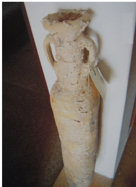
Fig. 1 - Spathéion provenant de la mer d'Arbatax (SALVI ET ALII 2005, p. 86).

Retrouvée par les carabinieri d'Arbatax en 1992, elle a une hauteur de 108 cm, un diamètre de 16,8 et une circonférence de 53 cm. Elle présente un corps cylindrique allongé et fin, un col prononcé flanqué par les anses, une lèvre grossie et arrondie (fig. 1). Sa datation est incertaine, mais elle s'est largement diffusée entre le IV e et le VII e siècle ap. J.-C. dans les régions de la Méditerranée et en Europe de l'Est, du Centre et du Nord. Elle servait à transporter de l'huile, des olives, des conserves de poissons et du vin.